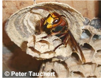
© Peter Tauchert Anfangsneest einer Hornisse