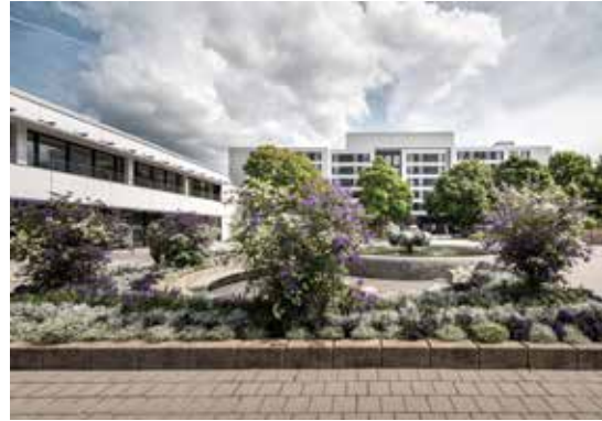
Calw-Hirsau Psikiyatri Merkezi

Zentrum für Psychiatrie Calw – Klinikum Nordschwarzwald