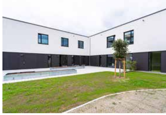
Psikosomatik Tıp Merkezi ve Gündüz Kliniği Leonberg

Psikiyatri Merkezi Calw - Klinikum Nordschwarzwald