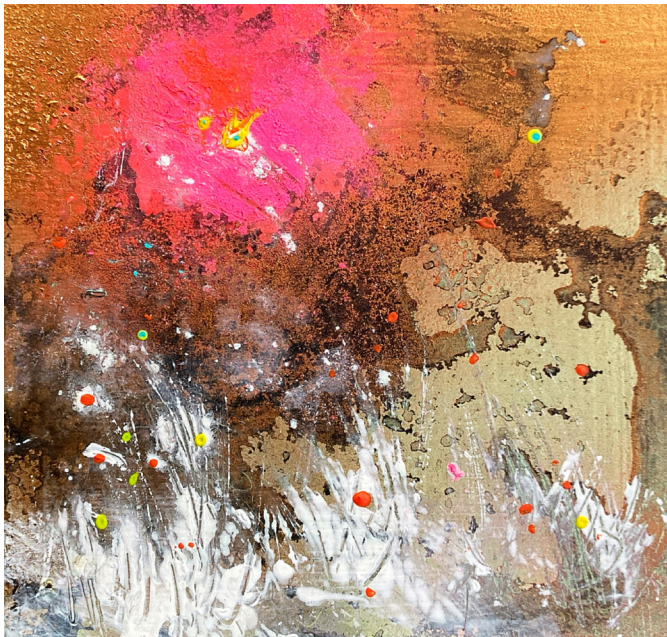
Timo Lindenmaier - Greetings from the Swamp, 2025