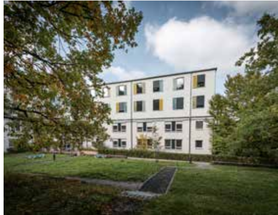
Klinik für Kinder- und Jugendpsychiatrie und -psychotherapie in Böblingen