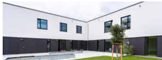
Zentrum für Psychosomatische Medizin und Tagesklinik Leonberg