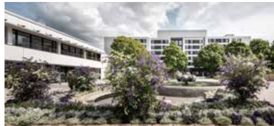
Zentrum für Psychiatrie Calw-Hirsau

Zentrum für Psychiatrie Calw – Klinikum Nordschwarzwald