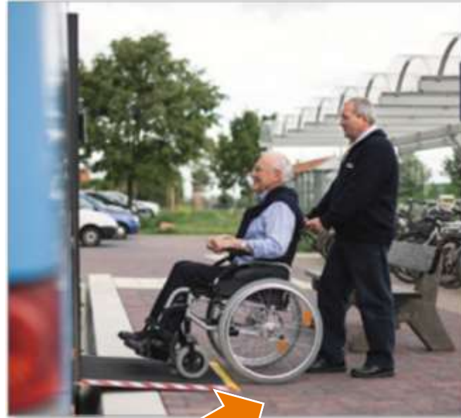
Rangierfläche notwendig für Rollstuhlfahrer