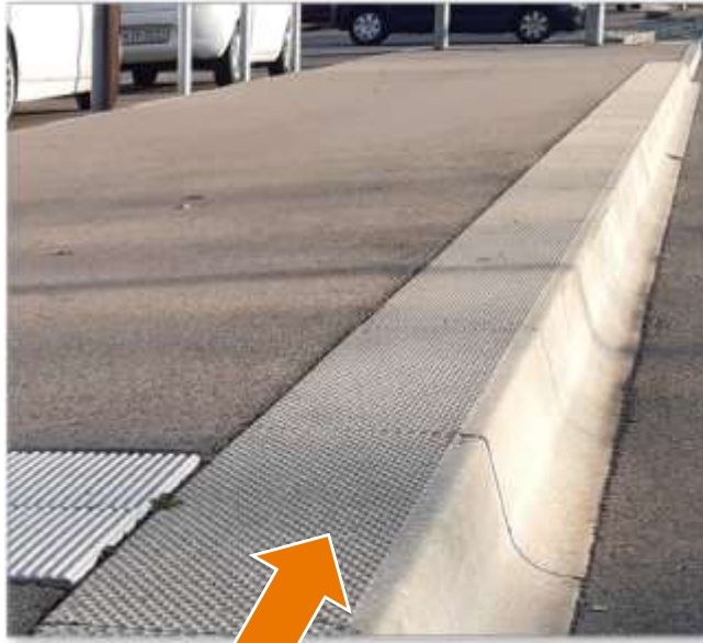
Hochbord (mindestens 18 cm)